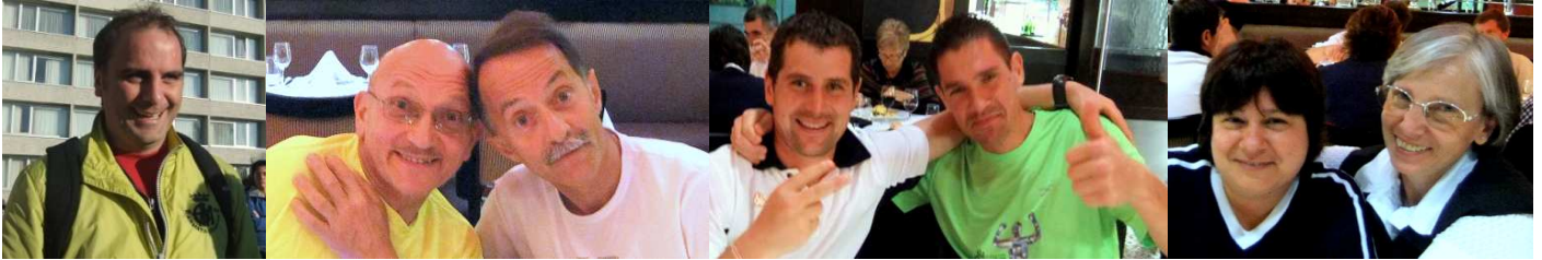
Oscar, sempre sorridente!